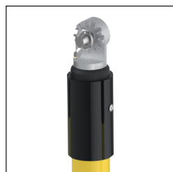
U Cabezal Universal