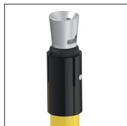
B Cabezal Bayoneta