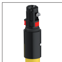
P Cabezal Polivalente (Hexagonal + Métrico-10)

Ajustadores estables Tubo de fibra de vidrio reforzado hasta 12 m