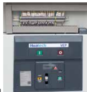
Detalle Interruptor Huatech