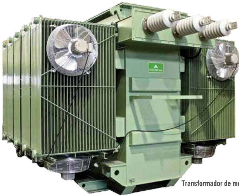
Transformador de media potencia para uso minero