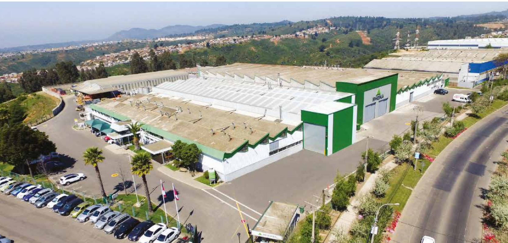
FÁBRICA RHONA VIÑA DEL MAR