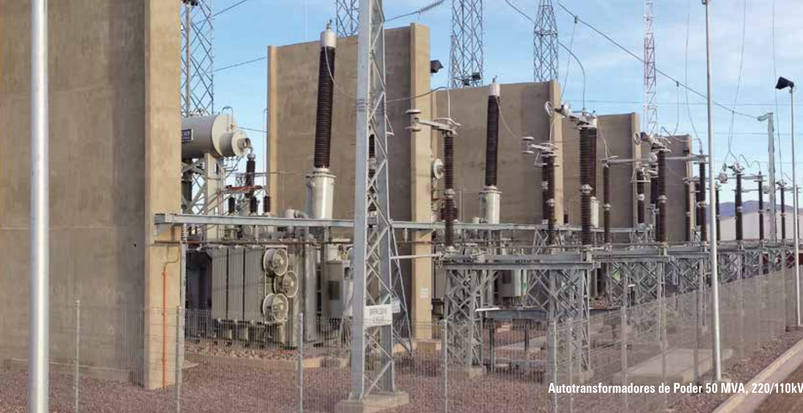
Autotransformadores de Poder 50 MVA, 220/110kV

Por medio de la alianza con importantes fábricas a nivel mundial, RHONA complementa su línea de transformadores de poder incluyendo equipos de hasta 1000 MVA y 750 kV, objeto de atender el creciente mercado regional en el segmento de 220 kV y principalmente 500 kV .