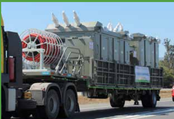
Centro de Maniobra y Protección en Media Tensión

Specially designed materials such as high temperature insulation and heat exchangers allow weight and size reduction in larger units.