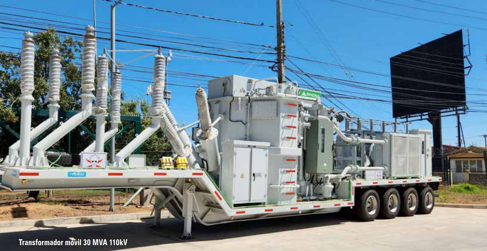
Transformador móvil 30 MVA 110kV