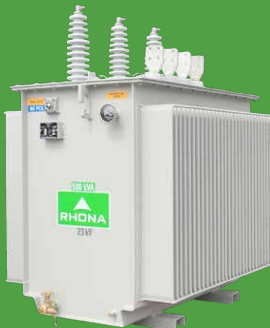
Transformador de distribución para montaje en 2 postes