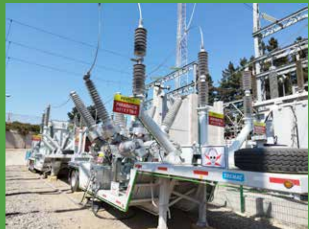
Interruptor de Poder de alta tensión

La consideración de materiales especiales como aislación para alta temperatura e intercambiadores de calor permite una reducción de peso y tamaño en potencias mayores.