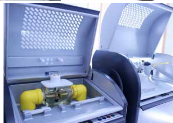
Análisis de aceite, Físico-Químico y Cromatografía