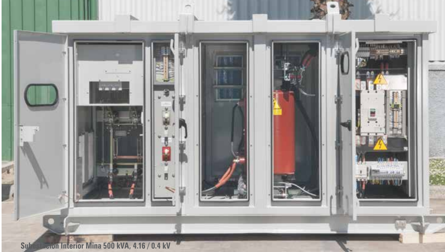
Subestación Interior Mina 500 kVA, 4.16 / 0.4 kV