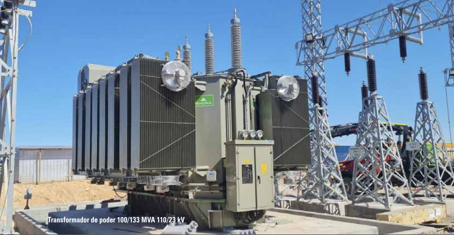
Transformador de poder 100/133 MVA 110/23 kV